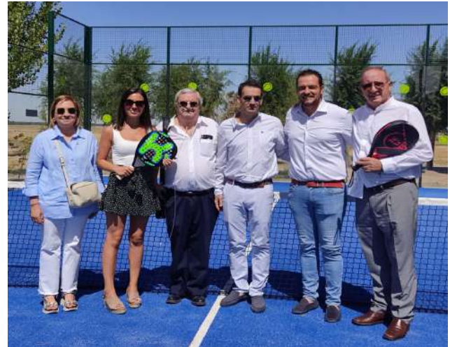
Bendición e inauguración Pista de pádel