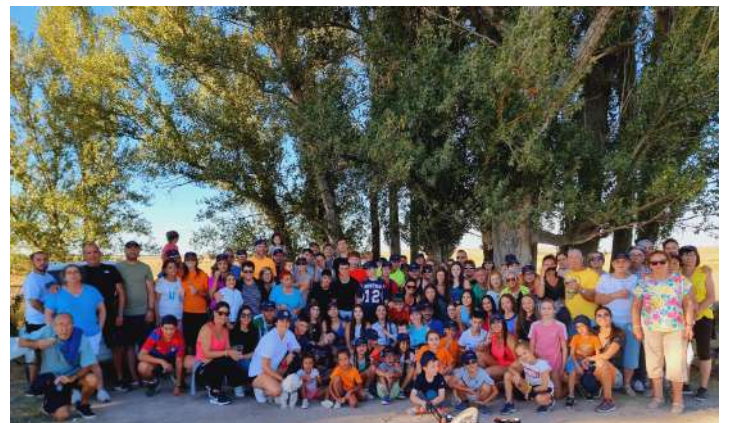
Excursión Arenas de San Pedro y La Montanilla