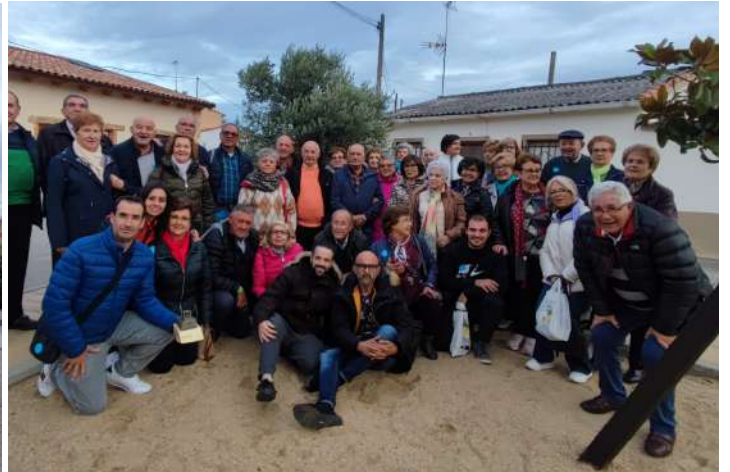
Encuentro Comunidad Viva San Miguel del Pino 21 de octubre de 2023