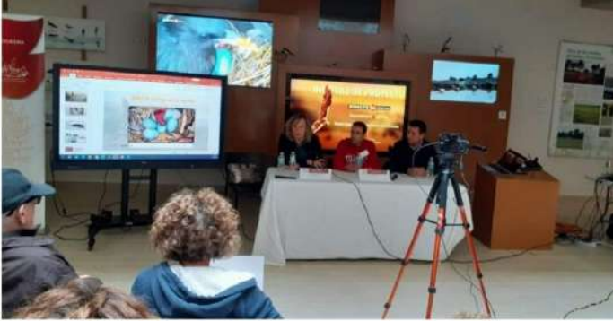
Jornada de la Escuela de Alcaldes en El Oso.